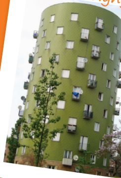
Tour Emile Aillaud à Bobigny

Chacun doit respecter les règles d'usage, le code de la route et l'environnement.