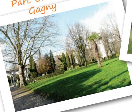
Parc Courbet Gagny