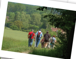
Château Bleu Vieux Pays de Tremblay